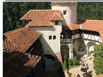
Circuit : 8 jours en PC a.p.d. 965 EUR