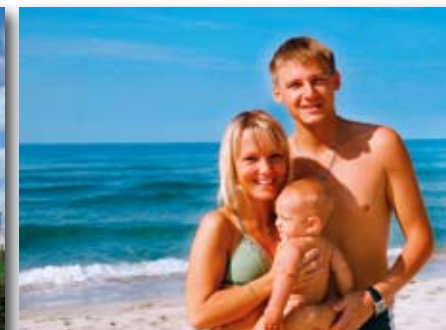
Séjour Plage : a.p.d. 371 EUR