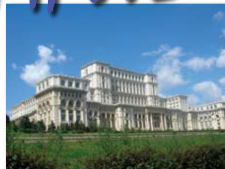
Citytrip : Radisson SAS 5* a.p.d. 369 EUR