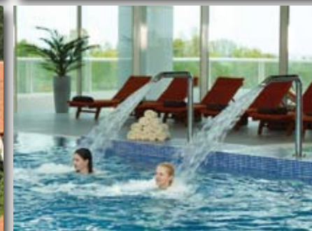
Thalssothérapie : 1 sem. a.p.d. 105 EUR